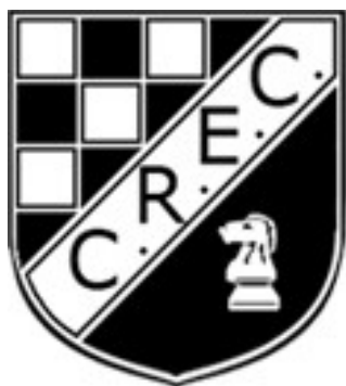
Cercle Royal des Echecs de Charleroi