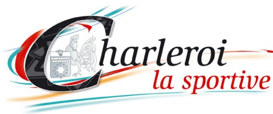
Charleroi La Sportive